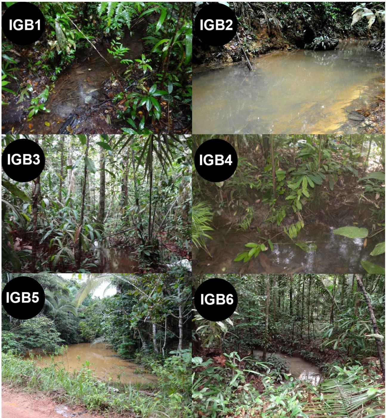
Figura 2. Fotos dos igarapés da microbacia do Belmont, inventariados no presente estudo. Siglas IGB1-IGB6: Igarapés Belmont.