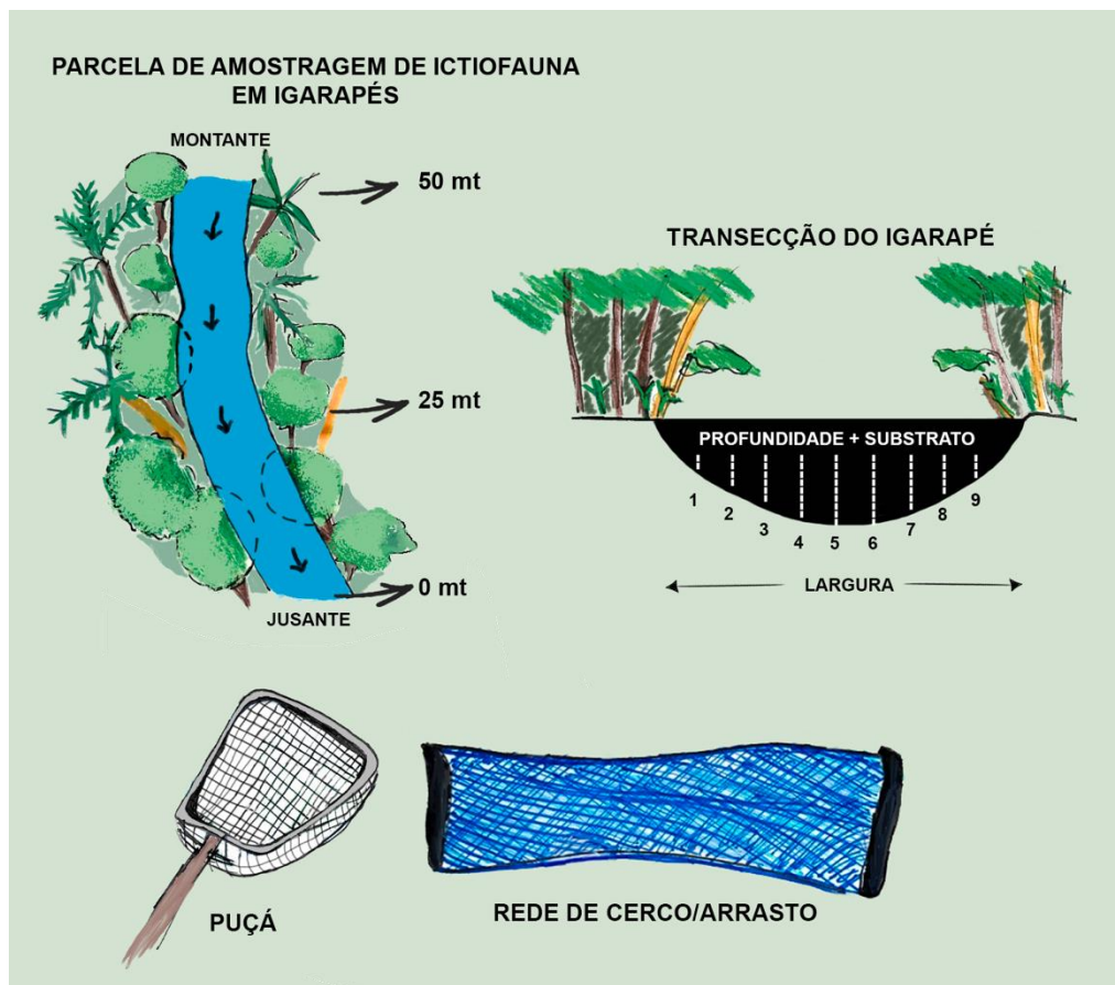
Figura 3. Representação esquemática da parcela de amostragem de ictiofauna em igarapés; da secção transversal de um ponto de registro das variáveis para caracterização ambiental (largura, profundidade e tipos de substrato), e dos apetrechos de coleta ativa utilizados na captura dos peixes.

cada transecção do igarapé (lado direito da Figura 3) nos pontos 0, 25 e 50 metros sentido jusante-montante. Foram registrados os seguintes parâmetros ambientais estruturais: i) profundidade (nove medidas em cada transecção); ii) largura do canal; iii) tipo de substrato ( e.g. lama, raízes, folhas, galhos, argila, areia, pedras, troncos, etc) – também registrados nove vezes em cada transecção; e iv) e velocidade do fluxo da corrente - estimada pela média do tempo que um objeto flutuante deslocava um metro no ambiente aquático, calculada a partir de três réplicas). Para os dados físico-químicos limnológicos utilizou-se sondas digitais portáteis (modelo Hanna ) para registrar: i) oxigênio dissolvido; ii) pH; iii) temperatura e iv) turbidez da água.